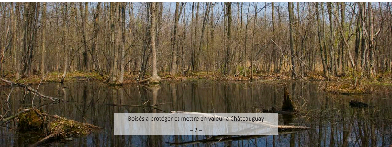
Boisés à protéger et mettre en valeur à Châteauguay

*Cette liste a été compilée à l'aide de la carte réalisé par le Service de génie de Ville de Châteauguay et portant le titre « Milieux naturels d'intérêt écologique principaux, Résultat de la recherche documentaire, Visites de terrain » et le numéro de plan « 07026 » datée du 30 avril 2007. Les milieux naturels ci-dessus sont considérés comme « milieux d'intérêt écologique » ou sont composés en partie d'un tel milieu.