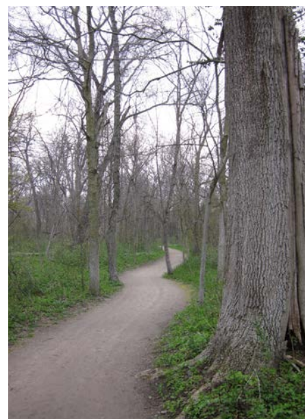
Boisés à protéger et mettre en valeur à Châteauguay