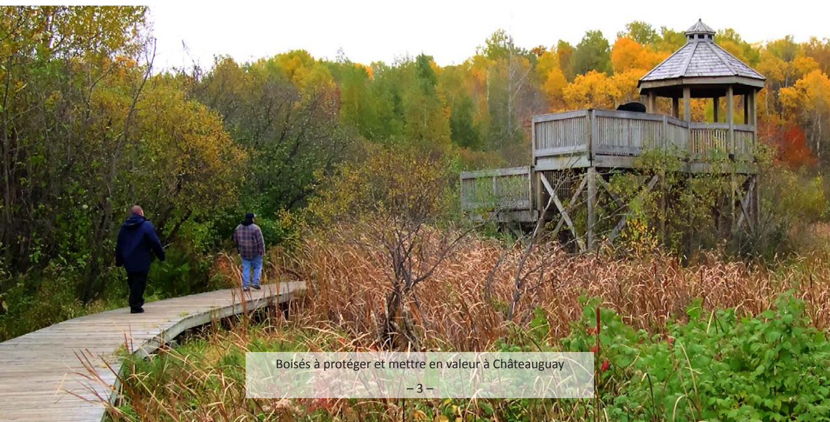
Boisés à protéger et mettre en valeur à Châteauguay