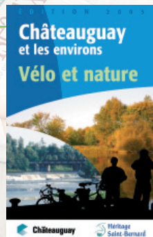
Concept: Point de Vue cartographie.

Pour compléter, la carte offre de l'information sur la rivière Châteauguay, le lac Saint-Louis, la maison LePailleur, le centre nautique, la navette fluviale, les croisières animées en ponton et l'observation des oiseaux. En 2005, 10 000 copies de la troisième édition ont été imprimées et distribuées.