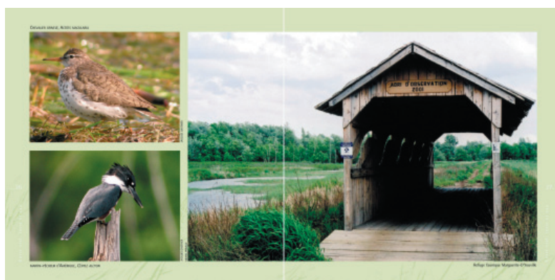
Concept : Point de Vue cartographie.