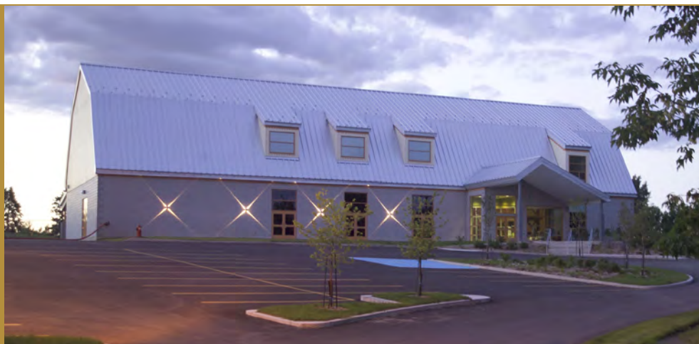
Pavillon multifonctionnel — Île Saint-Bernard

Afin de bien diriger les visiteurs sur le magnifique territoire qu'est le refuge faunique, Héritage Saint-Bernard a demandé à ce que soient installés des panneaux de signalisation, réservés aux milieux naturels protégés. Au total, neuf panneaux de signalisation bruns seront installés par la Ville de Châteauguay et le ministère des Transports. La signalisation interne de la Ville de Châteauguay sera également revue.